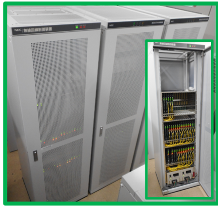
無線回線制御装置