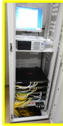
エリア登録サーバ